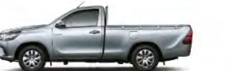
2.4J Plus ช่องสี่ล้อ