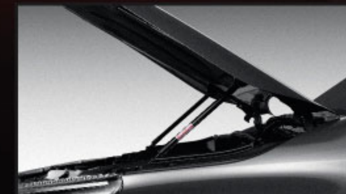
อุปกรณ์ช่วยผ่อนแรงเปิด-ปิดฝากระโปรงหน้า