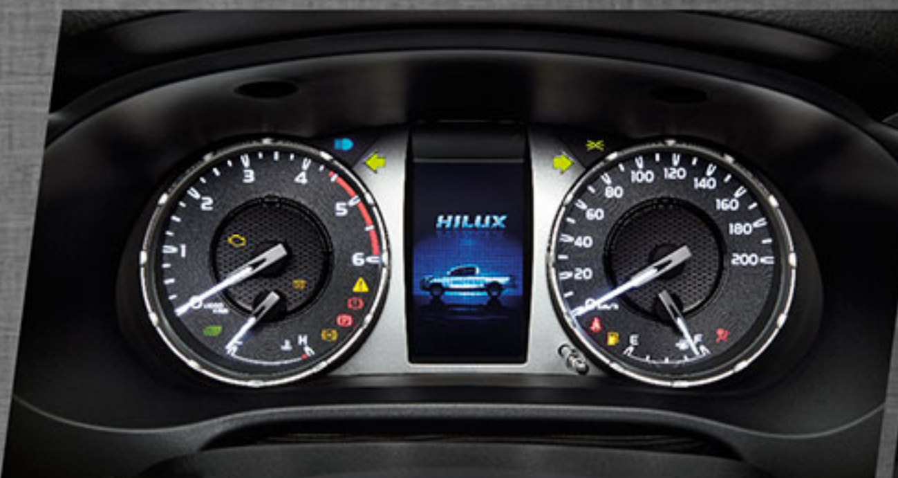
ใหม่ จอแสดงผลข้อมูลการขับขี่ TFT คมชัด สวยงาม อ่านง่าย