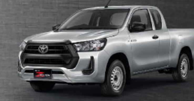
2.4 ENTRY STD MT