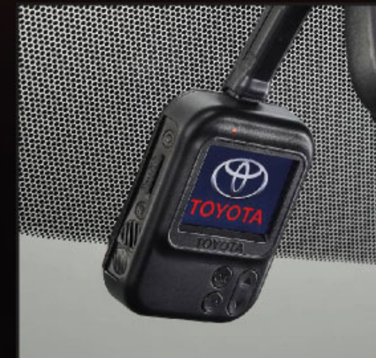
กล้องบันทึกภาพด้านหน้า