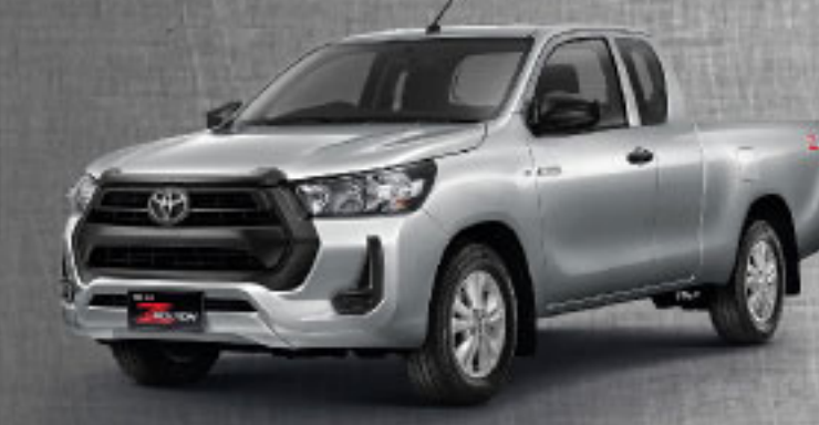
2.4 MID STD AT/MT