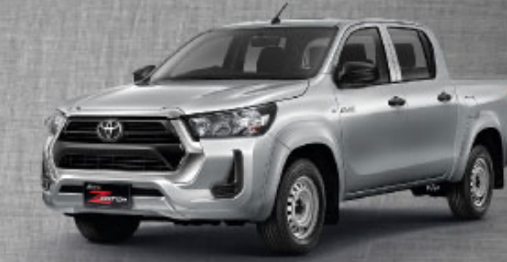
2.4 ENTRY MT