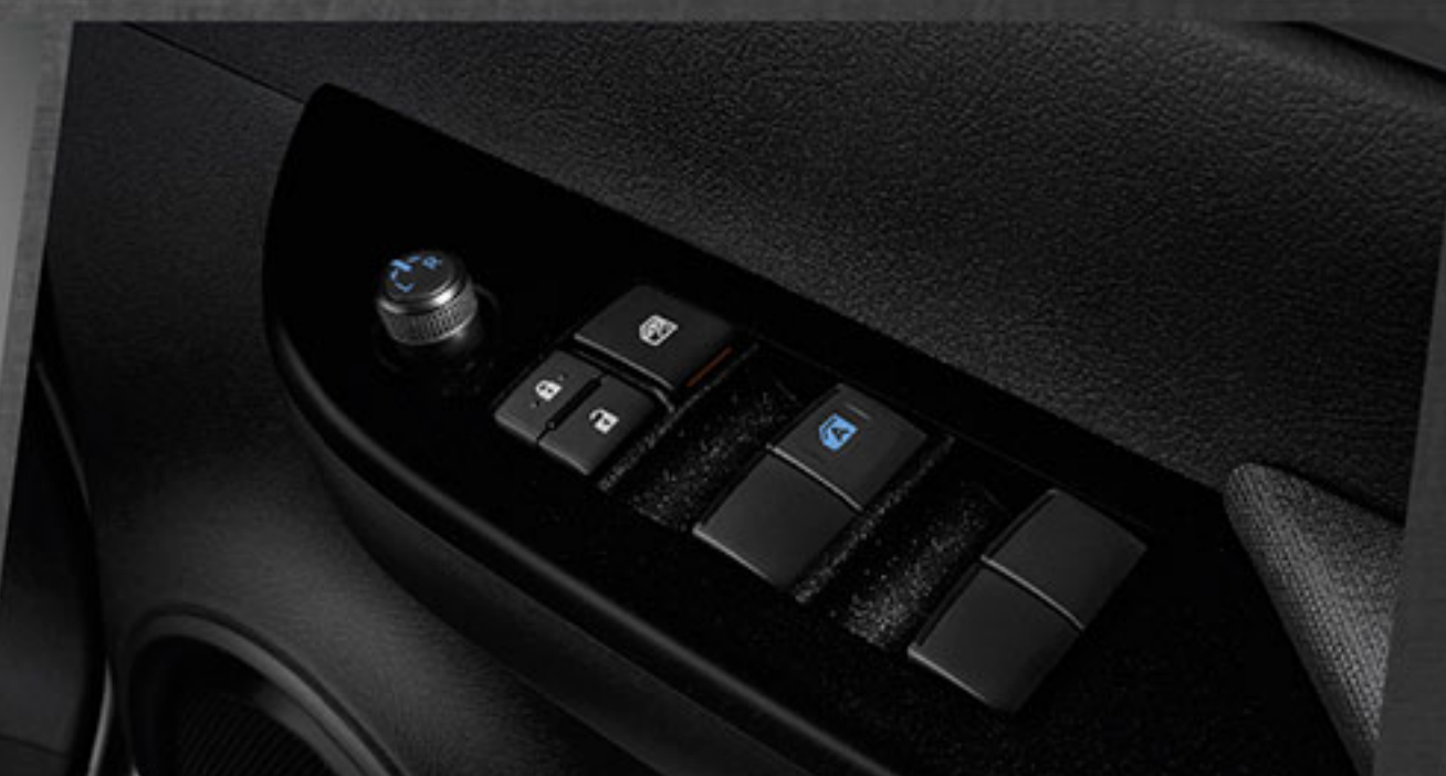
กระจกไฟฟ้า ปรับขึ้น - ลงอัตโนมัติ พร้อมระบบป้องกันการหนีบ