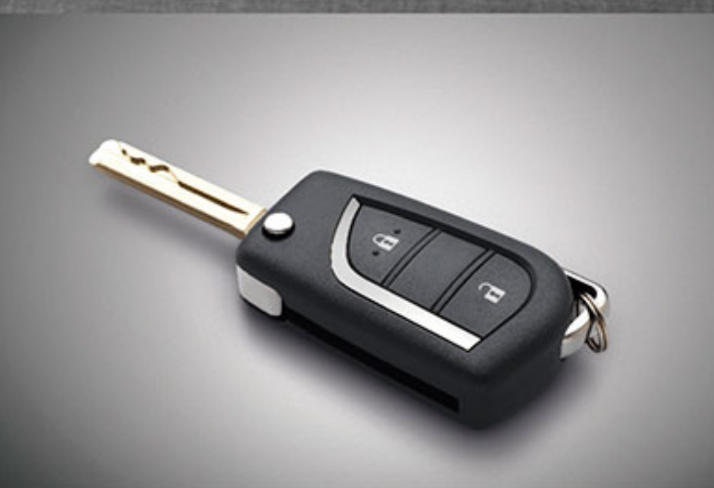
กุญแจรีโมท คีโซนแบบพับได้ (Jack Knife Key) ล็อกและปลดล็อกได้จากระยะไกล