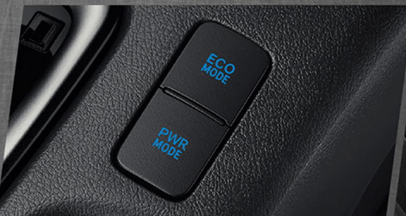
สวิตช์ปรับรูปแบบการขับขี่ เลือกได้ทั้งแบบประหยัด (ECO Mode) และแบบสมรรถนะสูง (Power Mode)