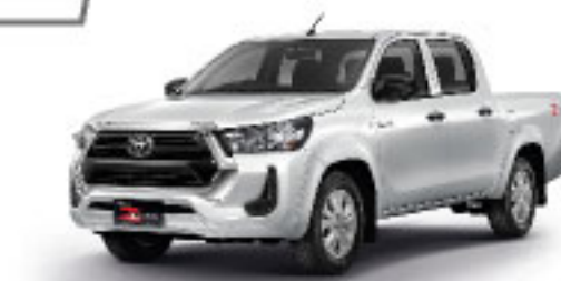
SUPER WHITE II