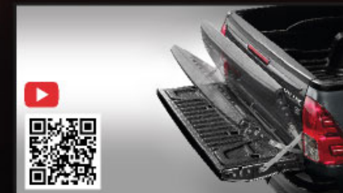
อุปกรณ์ช่วยผ่อนแรงเปิด-ปิดฝาท้ายกระบะ