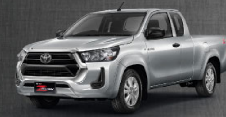
2.4 MID AT/MT