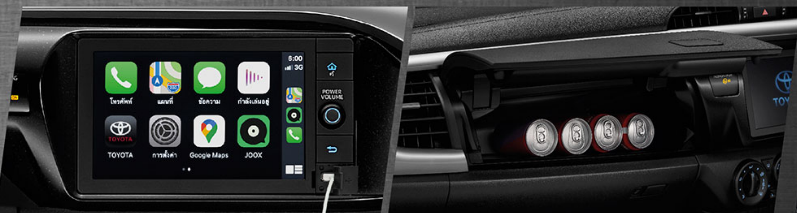
ใหม่ เครื่องเสียง รองรับ Apple CarPlay สะดวกสบายรองรับทุกความบันเทิง