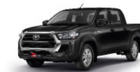
ATTITUDE BLACK MICA