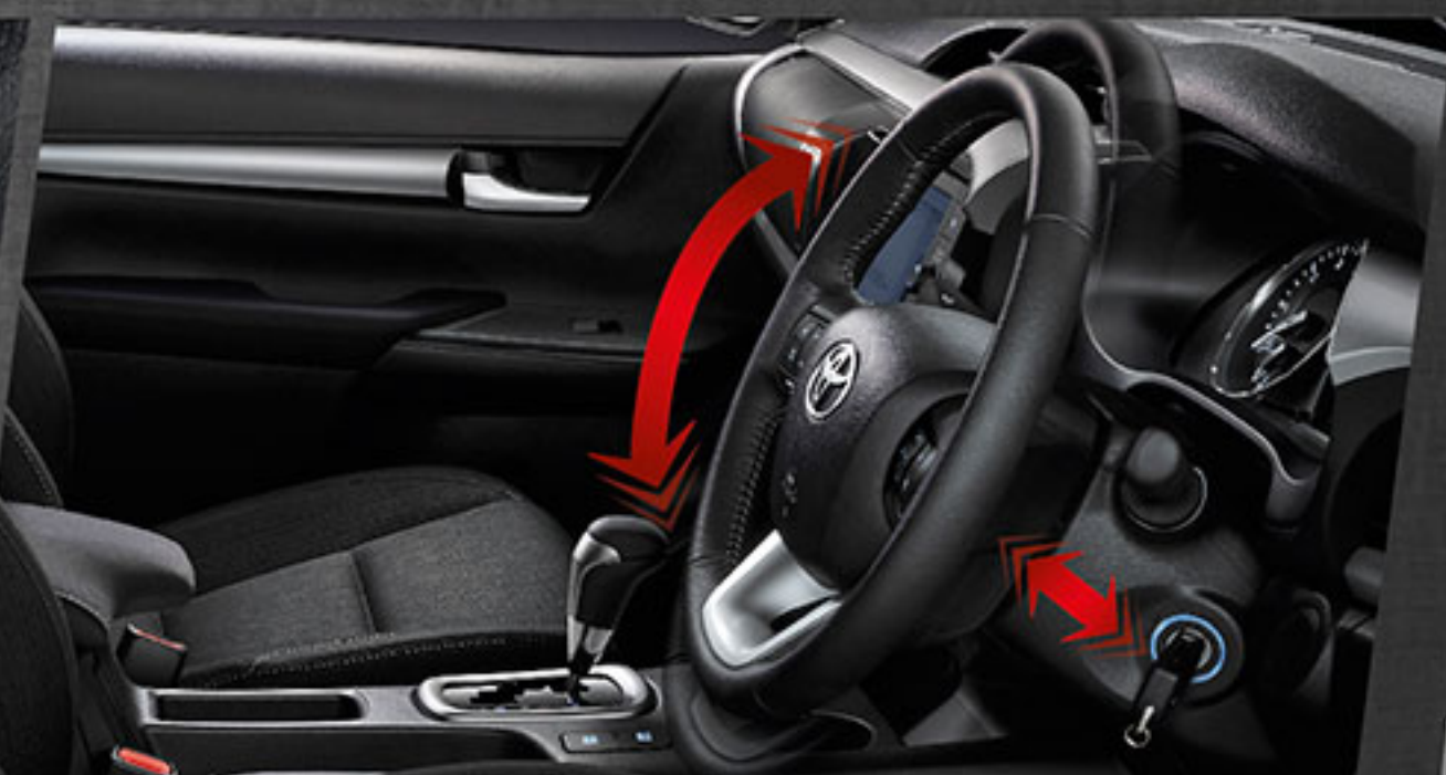
พวงมาลัยปรับระดับ 4 ทิศทาง พร้อมปุ่มควบคุมทุกฟังก์ชันการใช้งานครบครัน