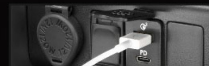
ที่ชาร์จภายในรถยนต์ (USB)