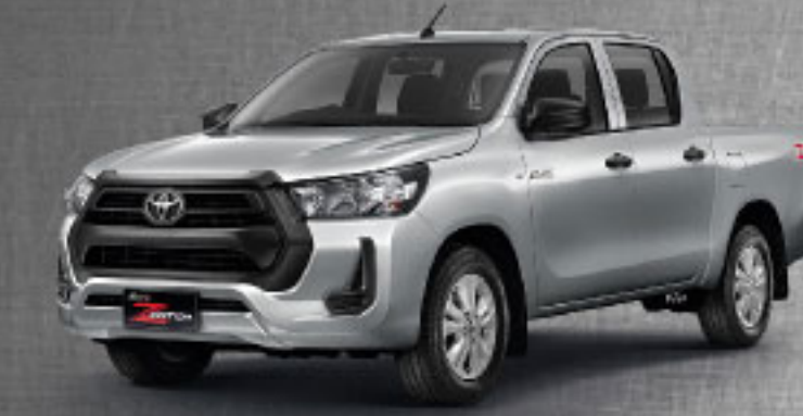
2.4 MID STD AT/MT