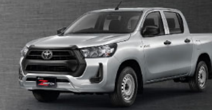
2.4 ENTRY STD MT