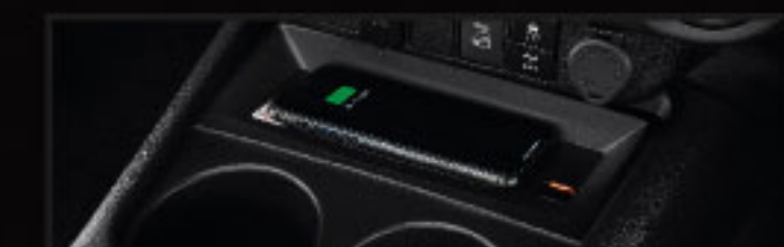
อุปกรณ์ชาร์จไฟแบบไร้สาย