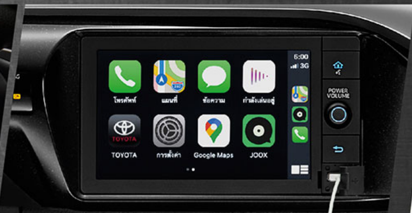
ใหม่ เครื่องเสียง รองรับ Apple CarPlay สะดวกสบายรองรับทุกความบันเทิง