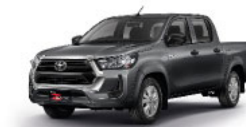
DARK GREY METALLIC