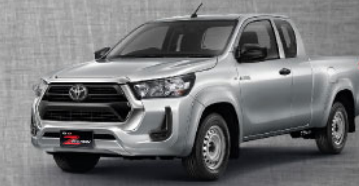
2.4 ENTRY MT