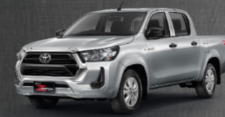
2.4 MID AT/MT