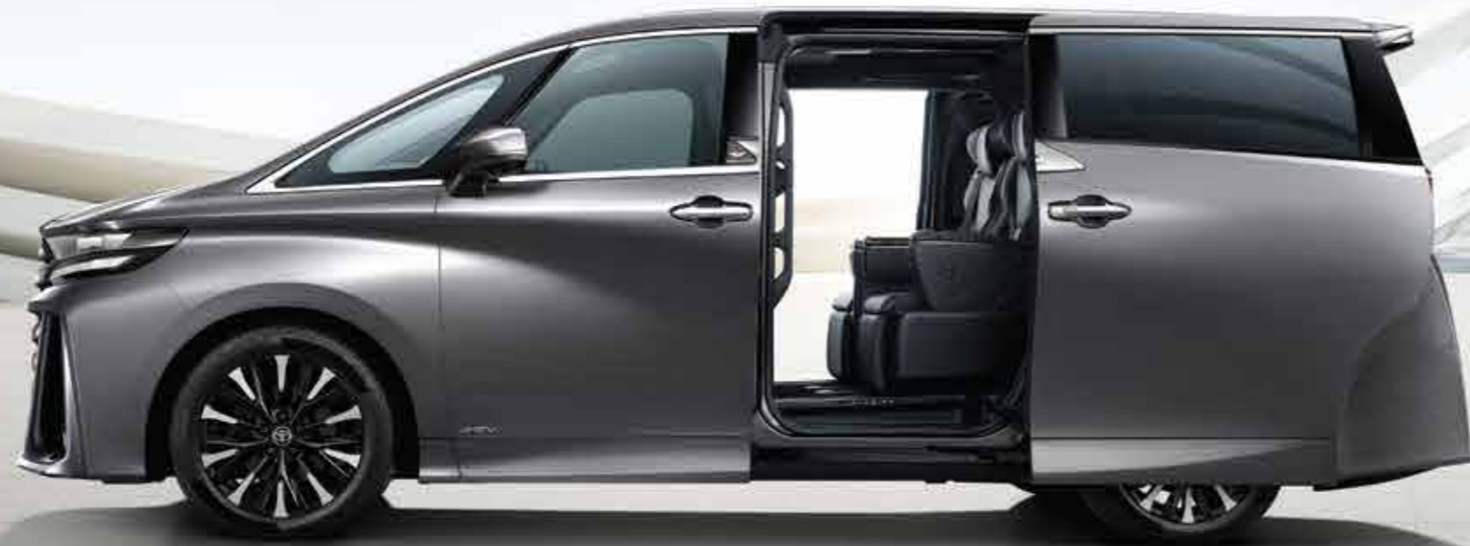
VELLFIRE 2.5 HEV