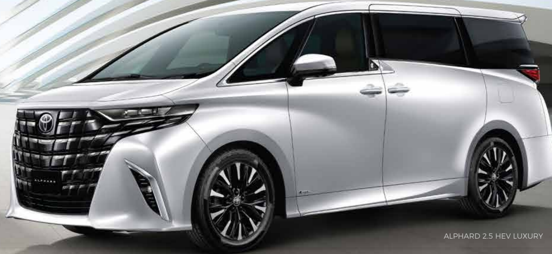
ALPHARD 2.5 HEV LUXURY

ยนตรกรรมหรู ที่มาพร้อมกับดีไซน์ภายนอกถ่ายถอดแนวคิด “ความสง่างามและทรงพลัง” การออกแบบภายในที่ปราณีตทุกรายละเอียด ห้องโดยสารกว้างและเซียบ ให้การขับเคลื่อนที่นุ่มนวล ที่สุดแห่งสุนทรีย์ในทุกการเดินทาง